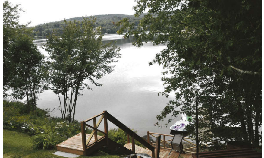
Le lac Rond, à Montcalm.

L'élaboration de ce plan directeur se fera sur