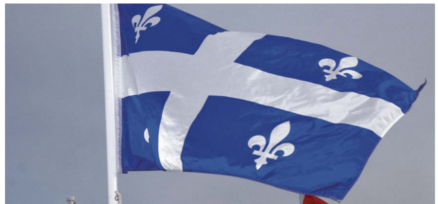
Le projet souverainiste n'est pas remis en cause par l'association péquiste de Labelle, qui préfère prôner de façon plus active l'indépendance du Québec que de revenir au gouvernement à court terme.